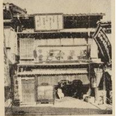
八二八一電屋都水んか羊 六町古 20