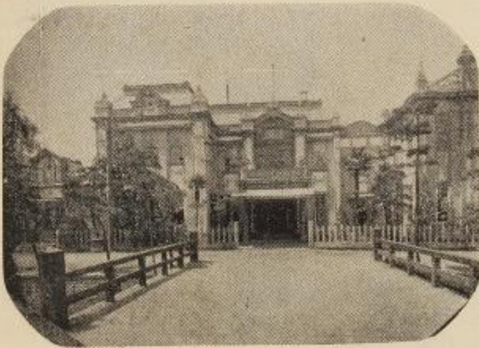
〇七二 長電 軒アリタイ 理料仰洋西七堀四 3 一七二 電