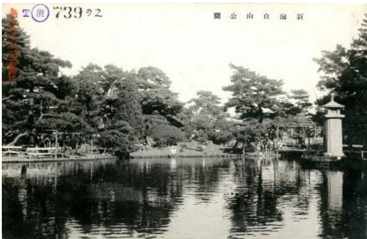
「新潟名所：新潟白山公園」（絵はがき）

https://www.pref-lib.niigata.niigata.jp/?page_id=1128 で「新潟県史収集写真」と入力して検索を行うと、戦前の古町や大正期のイタリア軒などのデジタル画像が見つかります。