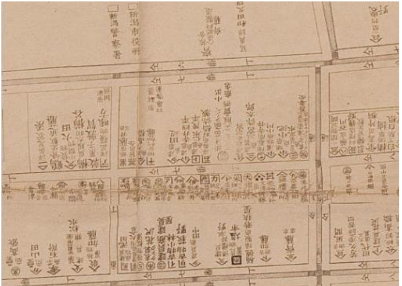
『新潟市商業家明細全図』