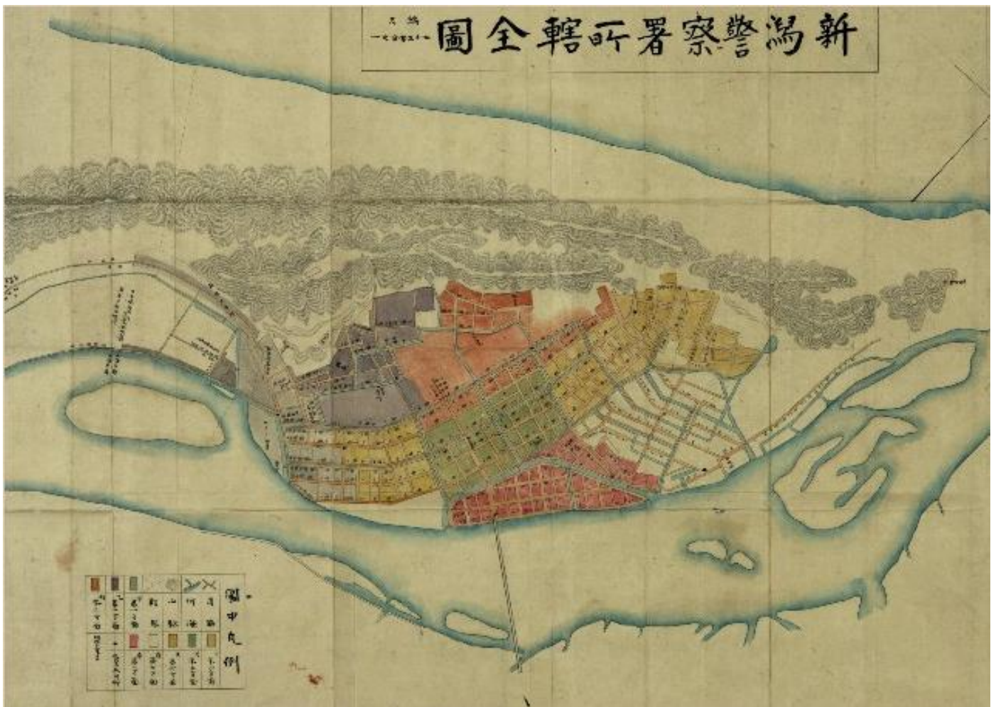
『各警察署管内全図』 新潟警察署管内全図

*明治21年発行の新潟警察署管内の地図です。明治19年(1886)に完成した初代の万代橋が記載されています。