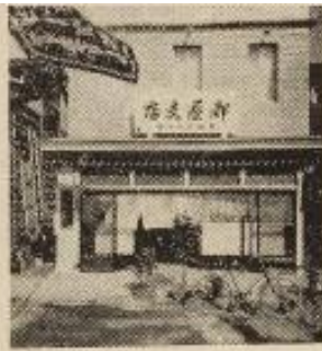
九町古 店支屋都 52 七六四電