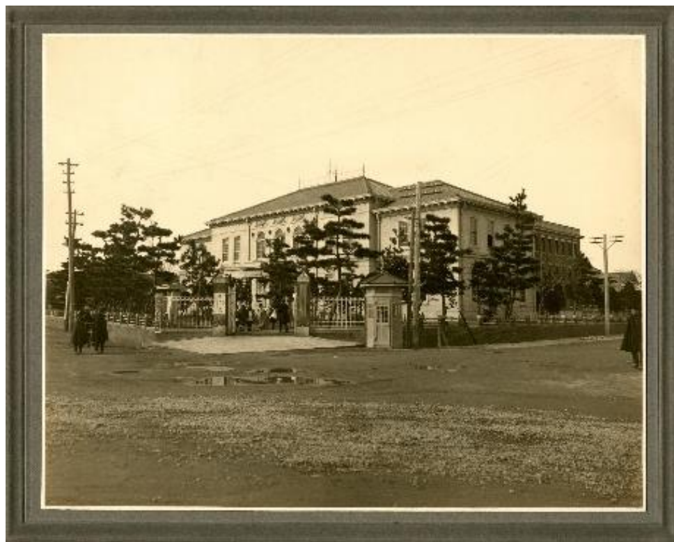
「明治記念新潟県立新潟図書館 全景」