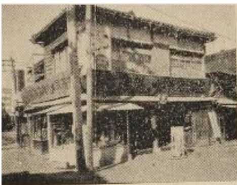
二橋所營店具文井永 諸洋具厨文 八四八一電 棟前 料材 6