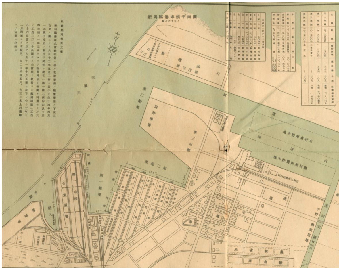
「新潟臨港埠頭平面図」(『最近の新潟』内)