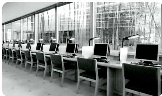
〔インターネットコーナー〕

持参したご自身のパソコンやワープロの利用ができるパソコン利用席を大幅に増やしました。座席にあるコンセントから電源を取ることも可能で、パソコンを使つての調査・研究がより便利になります。